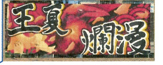
総合準優勝 横断幕賞 綱引き男子優勝 男子四季別代表リレー優勝